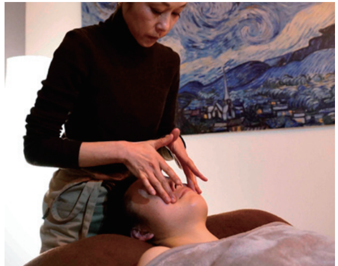
来客者の心身を癒す施術を

サロンを立ち上げ、3年が経過しました。サロンは武蔵野線吉川駅前のビルにございます。心身両方の健康と癒しの相談に応じることの出来る唯一無二のサロンを追求し、ホットペッパー予約サイトにて、お陰様で口コミ1位を獲得中です。