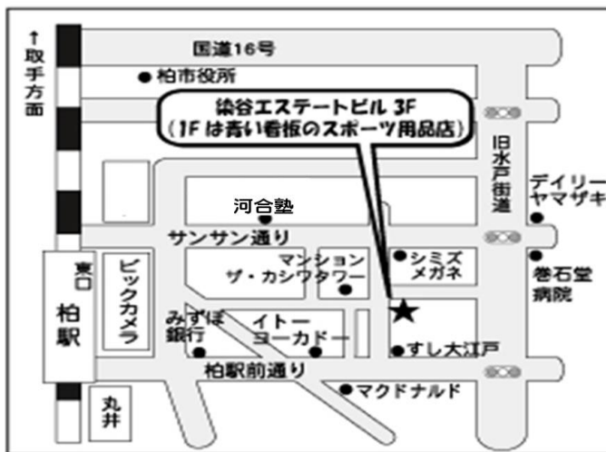
(東関東支部柏事務所) 柏市柏2-6-17染谷エステートビル3F